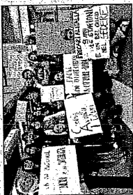
Una passata protesta Alitalia